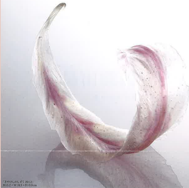
「はまけしのしずく 2012」 H152×W185×D10.0cm