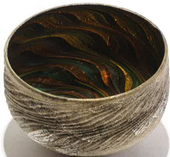
「風紋しろがね」ガラス H8.5×W11.5cm 2016年