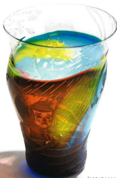
「ヒカリノアメノナカラユク」ガラス H29×W21×D21cm 2016年