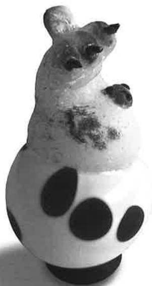
「ケモノ玉」ガラス H6.5×W4×D4cm 2016年