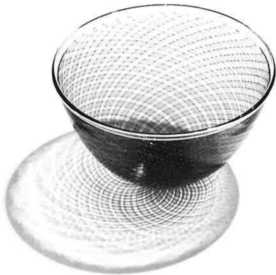
「色格子 ボール」ガラス H10.5×W17cm 2016年