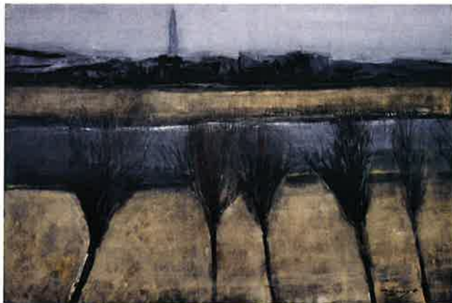
金原テル也《デジタルタワーの見える街道》