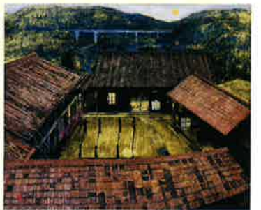
松井和弘《赤津焼瓦の陶房》