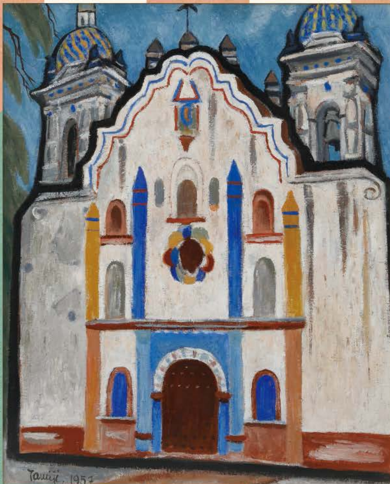
《ある村の教会のファサード》1957年